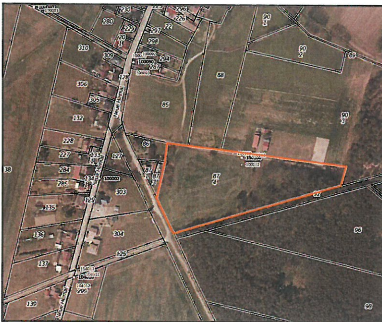
Luftbild Brandenburgviewer 2023

Vorhabenbezogener Bebauungsplan Nr. W 30 „Kohlsdorf Neue Heimat“ des OT Kohlsdorf der Stadt Beeskow