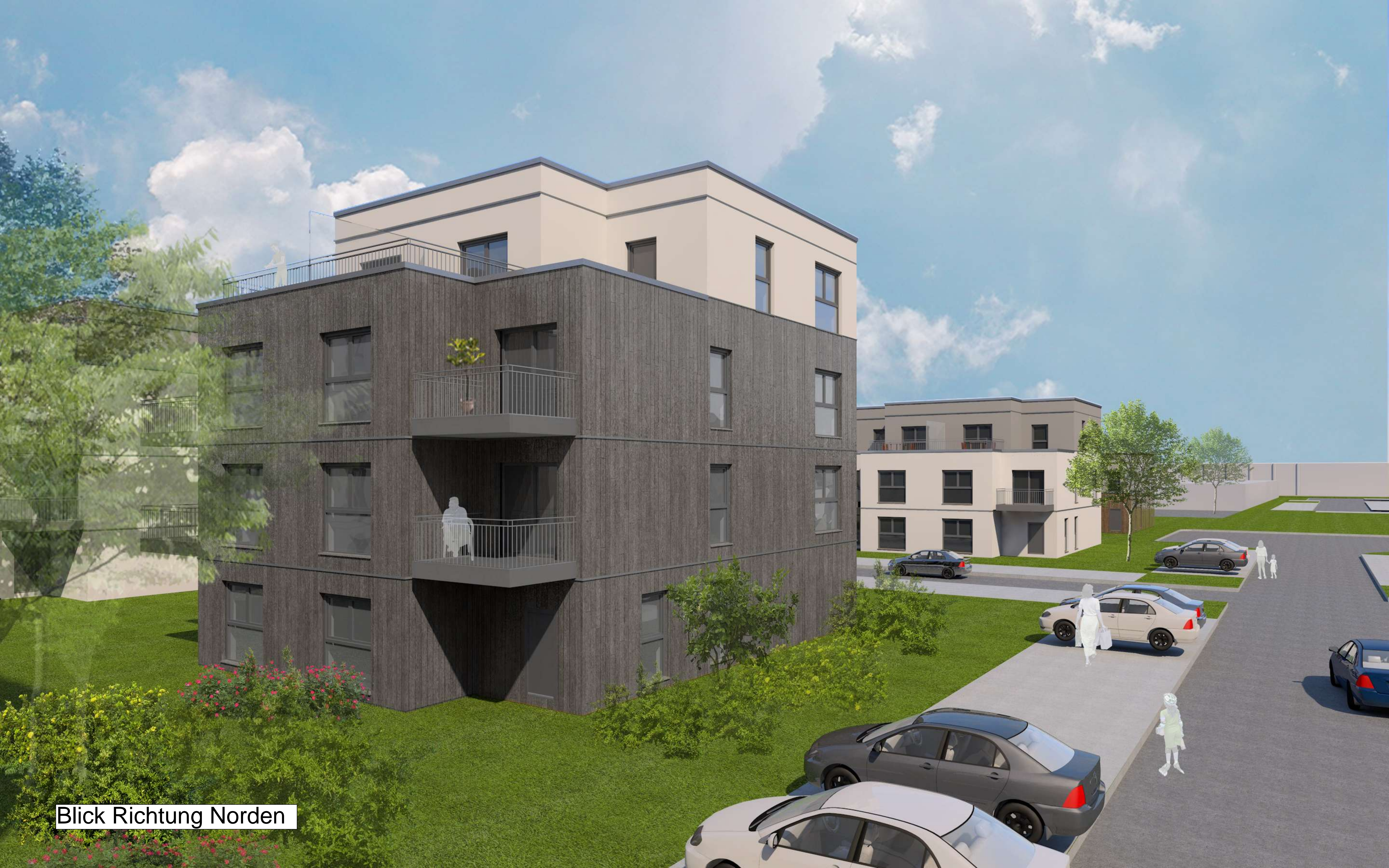
Blick Richtung Norden