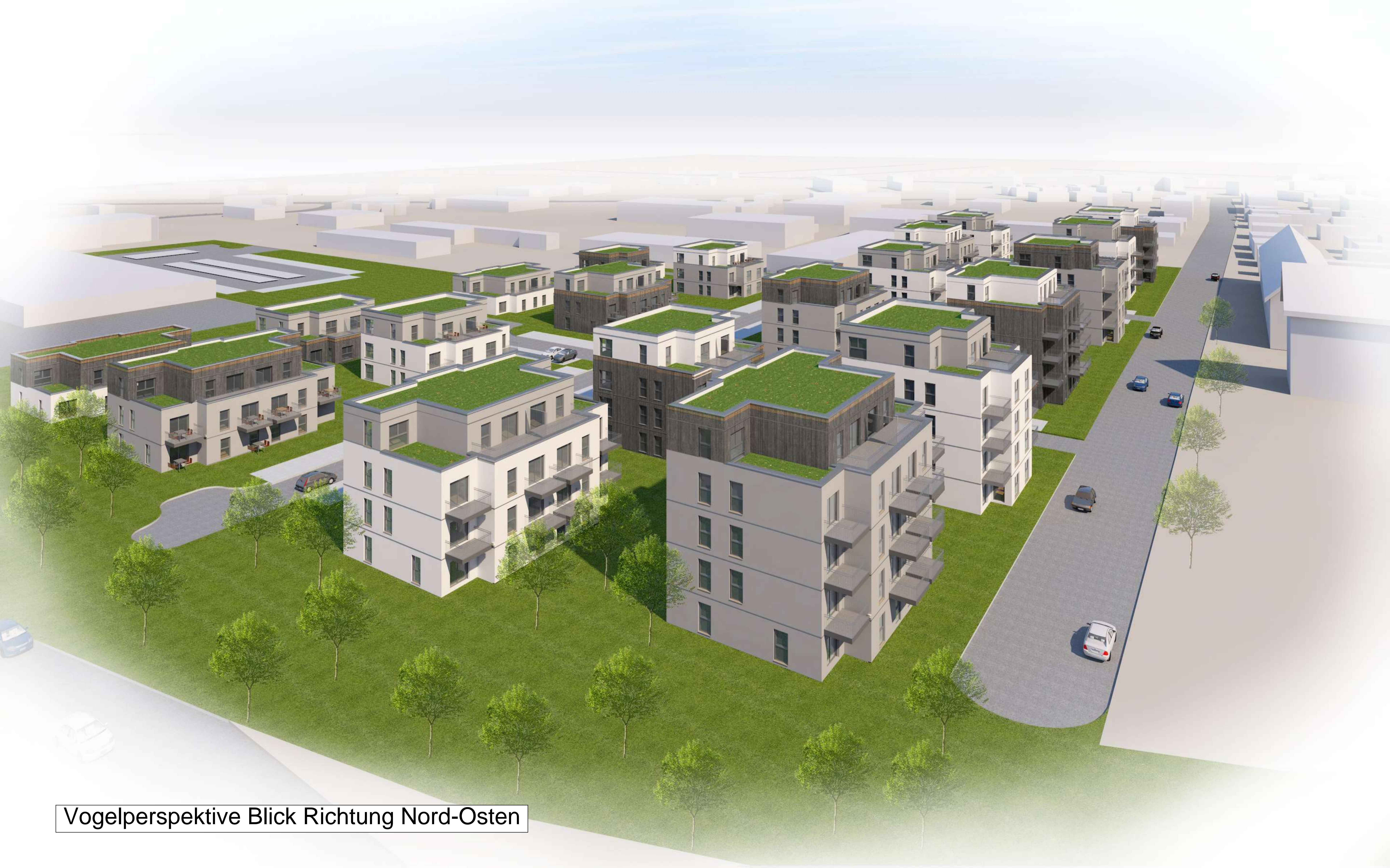
Vogelperspektive Blick Richtung Nord-Osten