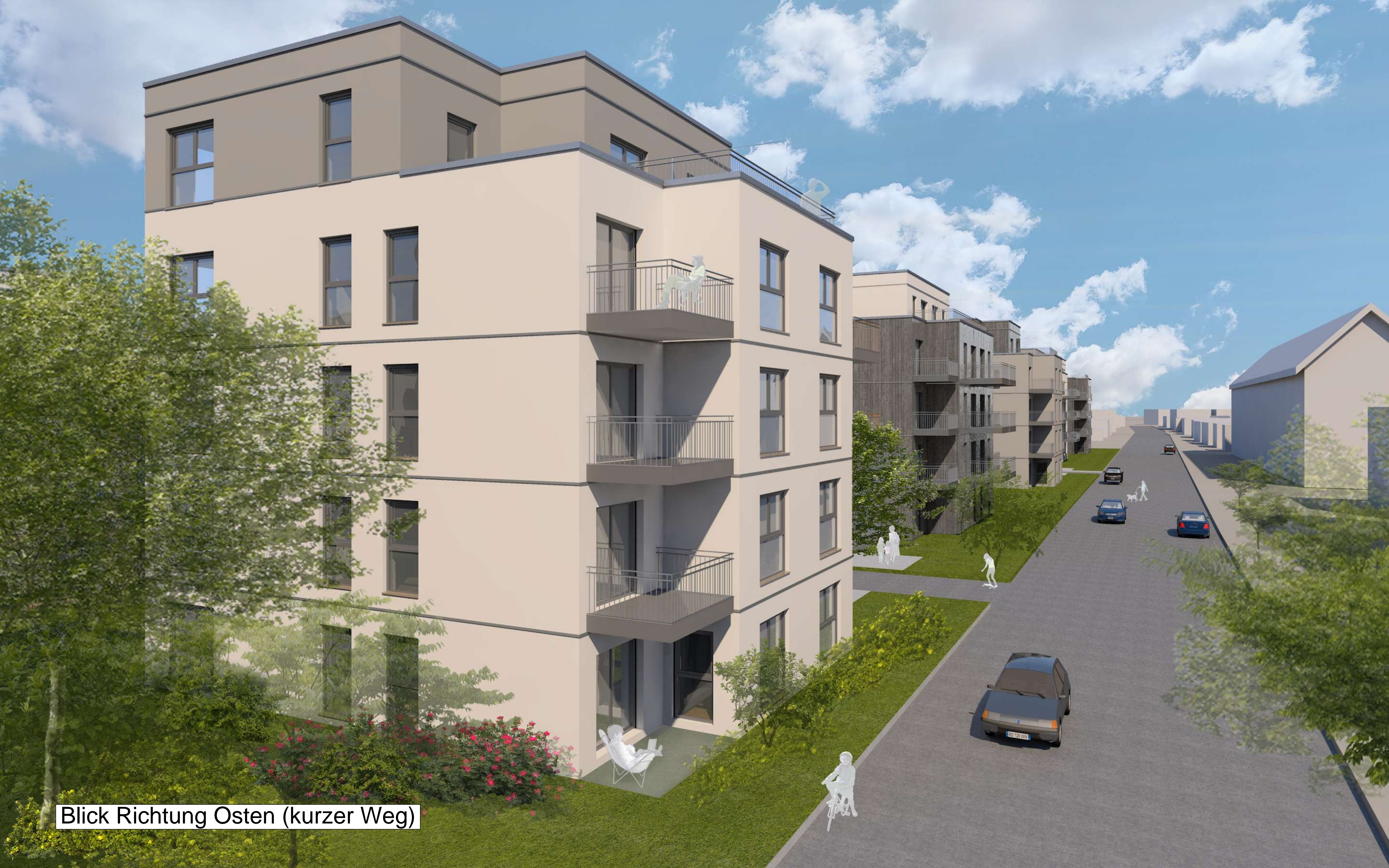
Blick Richtung Osten (kurzer Weg)