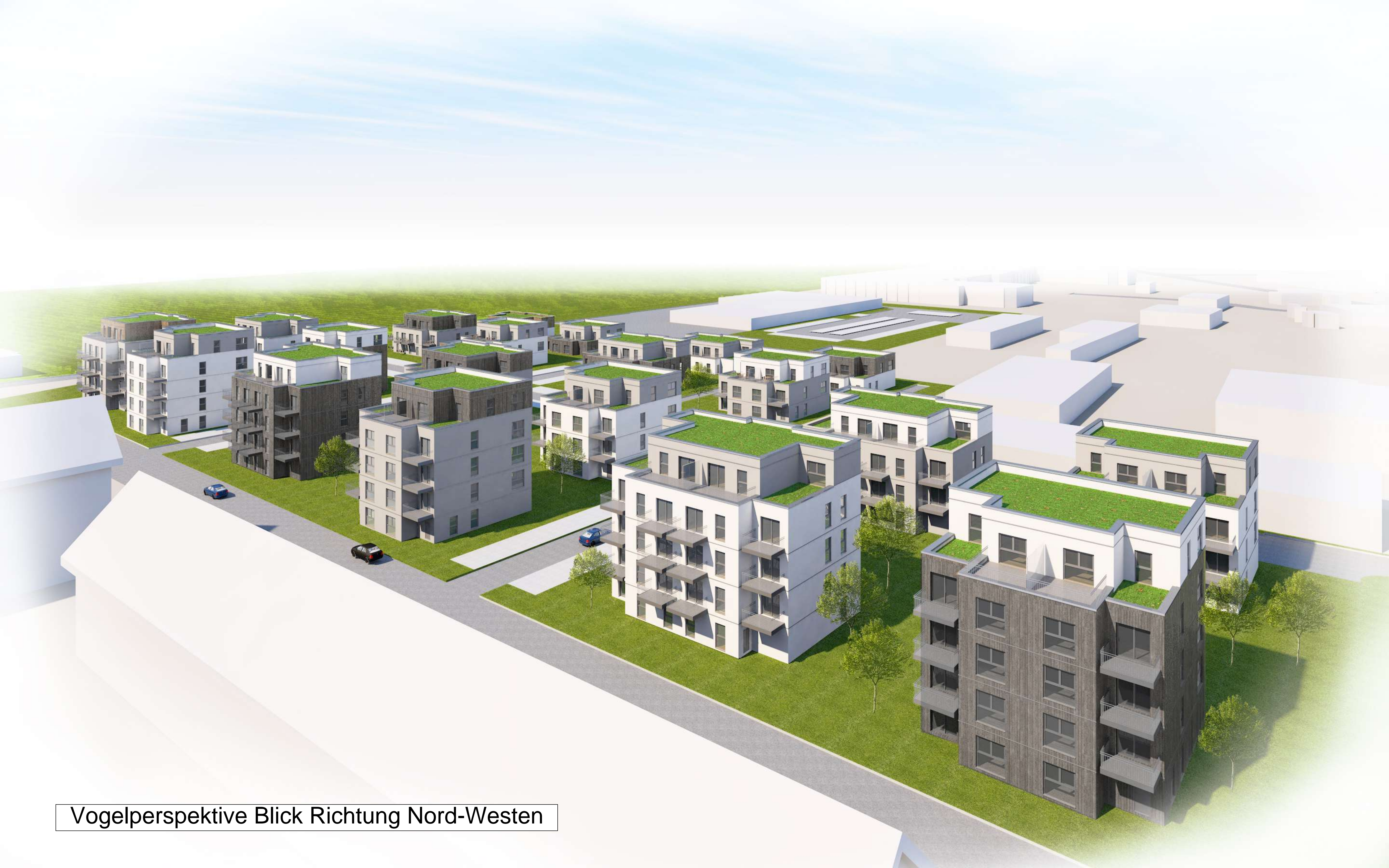
Vogelperspektive Blick Richtung Nord-Westen